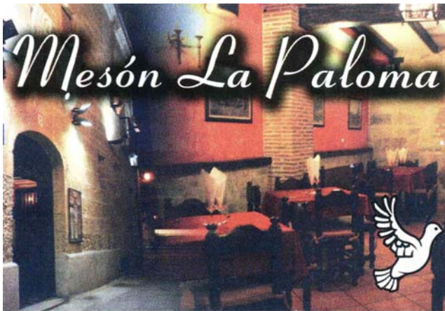
C/ La Paloma, 3 Teléfono 923462441 37500 Ciudad Rodrigo