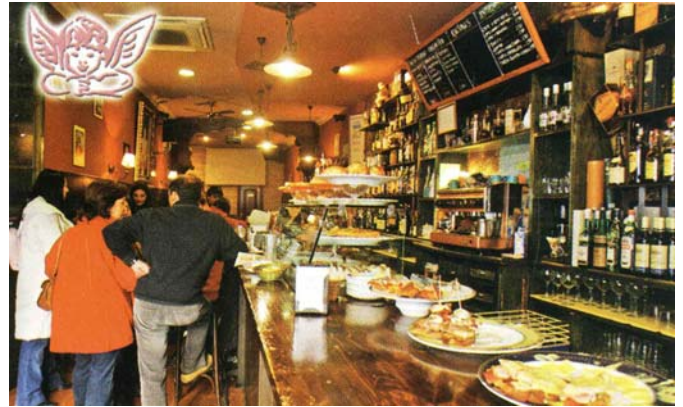
Especialidad en Tostas pinchos y Tapas Cafetería D'MORAN C/Colada, 3 37500 Ciudad Rodrigo