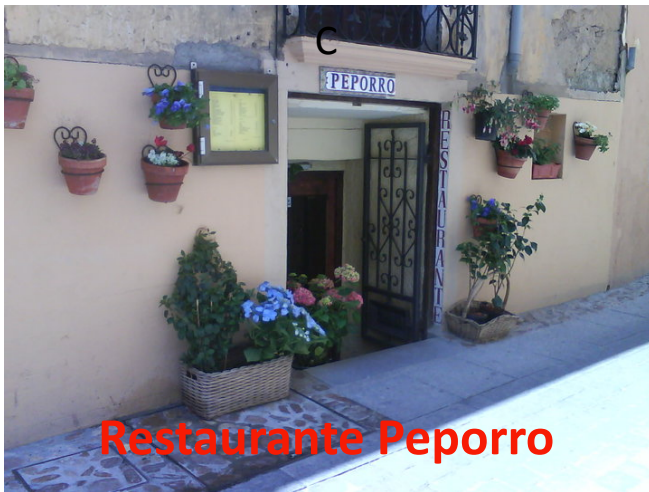
Restaurante Peporro C/ Gigantes, 5 Teléfono: 923 462 440 37500 Ciudad Rodrigo