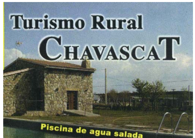
Posibilidad de Contratar Cuadras Teléfono: 692 892 900